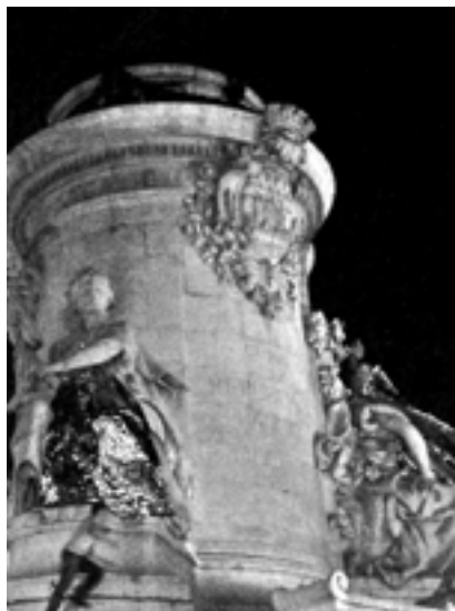
Place de la République, les statues avaient également revêtu les couvertures de survie

Nous étions près de 2000 personnes avec les trois statues de la Place de la République à symboliser par le port d'une couverture de survie notre solidarité à toutes les personnes n'ayant pas un logement. L'émotion de ce moment passé, les responsables associatifs, syndicaux, SDF, citoyens ont pu se rencontrer, échanger autour d'un bol de soupe au stand de l'Armée du Salut et tout cela en musique car toute la nuit, différents groupes de musique et chanteurs se sont succédés pour soutenir le mouvement citoyen.